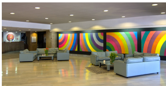
AlbornoZ Palace Hotel

Quota per la partecipazione al singolo Torneo € 25.00 Quota per la partecipazione ai tre giorni di torneo € 50.00 I premi saranno in oggetti e servizi offerti dagli Sponsor